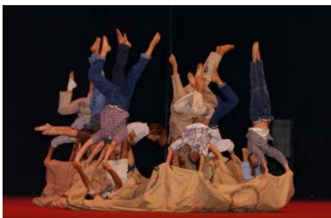
GINÁSTICA. A criatividade e a qualidade técnica da classe Ponto Zero, do Clube Atlético Alvalade, prometem animar a cerimónia de encerramento do AEED

O AEED decorreu num ano de particular interesse desportivo pela realização do Euro 2004, que Portugal teve a honra de receber e viver e dos Jogos Olímpicos de Atenas. O AEED pretendeu destacar certos valores que contribuem para a qualidade de vida em sociedade, como o trabalho de equipa, o “fair-play” e tolerância. Numa visão ainda mais abrangente, o intuito do AEED foi disponibilizar o desporto, enquanto factor educativo, ao serviço da humanidade, aproveitando o seu potencial na dissolução de barreiras, difundindo uma mensagem de amizade e de paz pelo mundo.