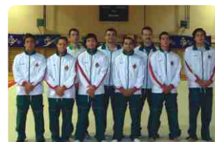
Seleção Nacional de Ginástica Artística Masculina e seus treinadores

Acompanhe os feitos dos nossos ginastas e o dia-a-dia dos campeonatos nos sites www.infoginastica.net e www.wch2006art.com . ▲