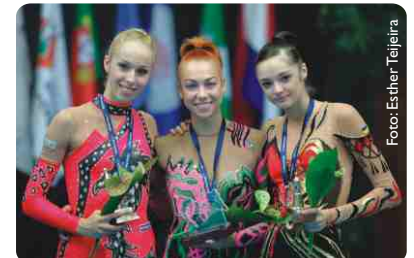
Da esquerda para a direita: Inna Zhukova (BLR), Natalia Godunko (UKR) e Anna Bessonova (UKR)