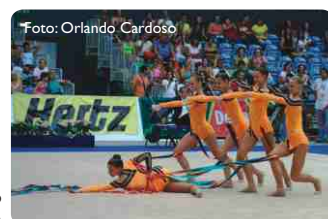
Conjunto da Bielorrússia

Os resultados das finais de conjuntos foram os seguintes: "3 arcos e 4 maçãs" - 1.º Bulgária, 2.º Espanha e 3.º China "5 Fitas" - 1.º Bielorrússia, 2.º Bulgária e 3.º Espanha ▶