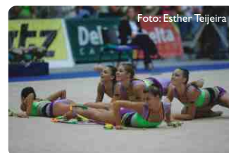
Conjunto da Bulgária