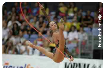
Anna Bessonova (UKR)