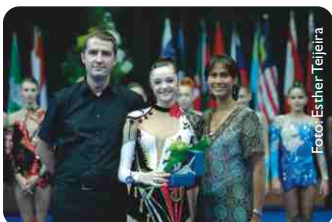
Anna Bessonova (UKR)

À margem da competição, os fotógrafos presentes escolheram a ucraniana, Anna Bessonova, como a ginasta mais elegante em competição. Este prémio "Elegância D'Villena" é um título atribuído todos os anos pelos fotógrafos nacionais e internacionais presentes no TIP e patrocinado pela empresa D'Villena. ▲