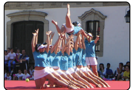
Apresentação do GIPA

Todos os participantes regressaram a casa ansiando já pela próxima edição do PortugalGym Gymnaestrada Nacional em 2009.