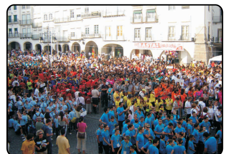
Desfile de todos os Clubes na Praça do Giraldo.