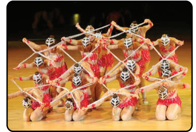
Ritmica de Representação (Ginásio Clube do Sul) - Gala FIG

Por fim, a Federação de Ginástica de Portugal gostaria de agradecer publicamente aos participantes nacionais neste evento que deixaram uma excelente imagem da Ginástica e do nosso País junto de todos aqueles que viveram a 13ª Gymnaestrada Mundial. Muito obrigado e até Lausanne na 14ª Gymnaestrada Mundial 2011!