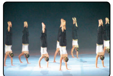
Especial Raparigas (Lisboa Ginásio Clube) - Noite de Portugal