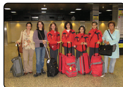
Seleção Nacional na partida para o Campeonato do Mundo em Patras (Grécia)

Esta competição confirmou a evolução sustentada do rendimento as ginastas individuais da selecção nacional - continuando a espiral positiva iniciada nos Mundiais de 2005, altura em que o rendimento das ginastas portuguesas passou a ser superior à média das competições mais importantes em que haviam participado. Em termos estatísticos o aparelho em que se registou menor evolução de rendimento foi nas maças, enquanto a maior evolução foi na corda.