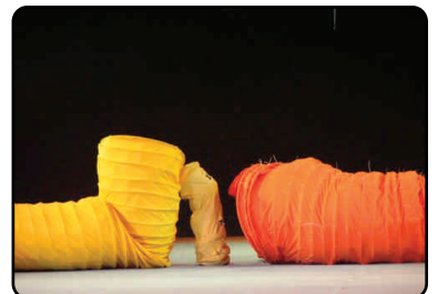
PZ (Ginásio Clube Português) - Gala FIG